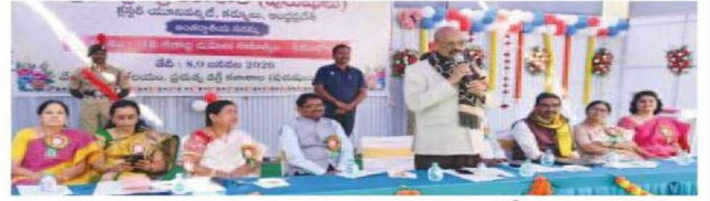
మాట్లాడుతున్న మాజీ రాజ్యసభ సభ్యులు టీజీ వెంకటేష్

కర్నూలు రూరల్ బ్యూరో, జనవరి 8, (ఆంధ్రప్రభ): విద్యార్థి దశ నుండే విద్యార్థులు సాహిత్యం, కళారంగాలపై అవగాహన ఆసక్తి పెంచుకోవాలని మాజీ రాజ్యసభ సభ్యులు టీజీ వెంకటేష్ అన్నారు. స్థానిక బి క్యాంప్ నందు ఉన్న ప్రభుత్వ పురుషుల డిగ్రీ కళాశాల నందు 21వ శతాబ్దం మహిళ సాహిత్యం- సమాలోచన అన్న అంశంపై ఏర్పాటు చేసిన అంతర్జాతీయ సదస్సును ఆయన ముఖ్యఅతిథిగా హాజరై ప్రారంభించారు. ఈ సందర్భంగా టీజీ వెంకటేష్ మాట్లాడుతూ ప్రస్తుత తరాల వారిలో సాహిత్యం పట్ల ఆసక్తి తగ్గుతుందన్నారు. సాహిత్యం, కళలు మన సంస్కృతి సంప్రదాయంలో భాగమని ఆయన తెలిపారు. ప్రతి ఒక్కరూ విద్యార్థి దశ నుండే వీటి పట్ల ఆసక్తిని పెంచుకుంటూ, దురాలవాటుకు లోను కాకుండా మంచి అలవాట్లను అలవర్చుకోవాలని ఆయన కోరారు. ప్రస్తుత సమాజంలో యువత మరి సున్నిత మనస్సులుగా మారుతున్నారని ఆయన తెలిపారు. ప్రతి చిన్న విషయానికి కూడా విడాకులు తీసుకునే సంస్కృతి పెరుగుతుందని ఇది మంచి పద్ధతి కాదన్నారు. కొత్తగా పెళ్లైన వారు ఒకరి మీద ఒకరు ఆధిపత్య ధోరణితో కాకుండా ఒకరినొకరు అర్థం చేసుకునే విధంగా ముందుకు పోతే జీవితం సాఫీగా కొనసాగుతుందని టీజీ తెలిపారు. అలాగే విద్యార్థులు