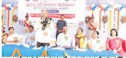
అంతర్జాతీయ సాహిత్య సదస్సులో మాట్లాడుతున్న టీజీ వెంకటేష్